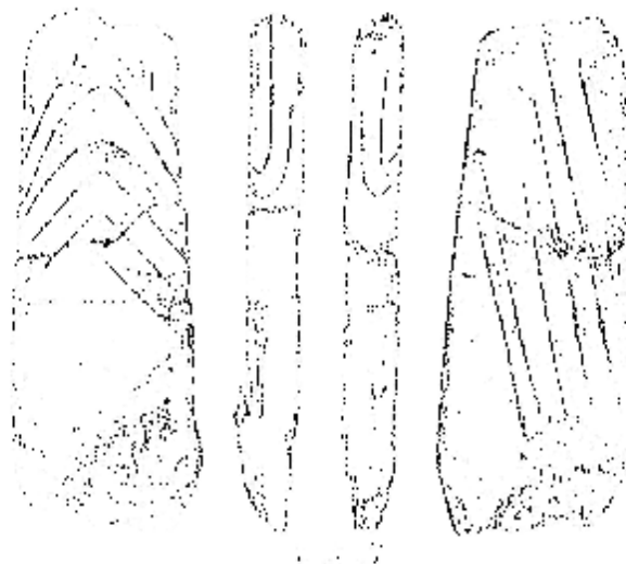
Рис.2. Антропоморфна стелла з урочища Новина с. Мишків – знахідка 1981 р.

Хронологічними ознаками виявлених ідолів є їх зовнішні обриси, зображення та археологічні матеріали, що пов'язані з ними. Згідно з цими показниками, найдавнішими язичницькими скульптурами на сьогоднішній день є ідоли з с. Мишків Тернопільської області, виготовлені